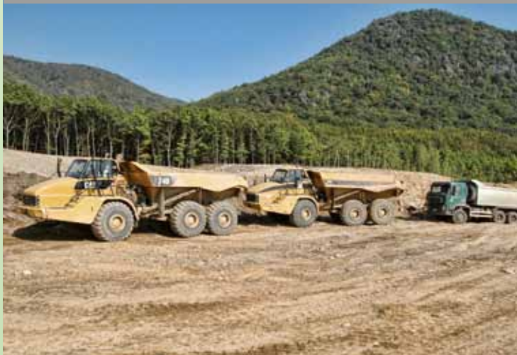
SANACE SEVEROZÁPADNÍCH SVAHŮ