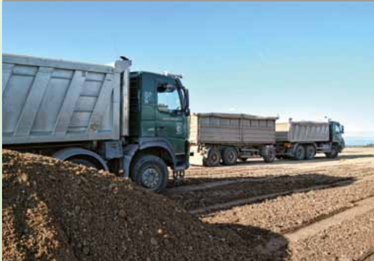
DODÁVKY ZEMIN NA STAVBU R7