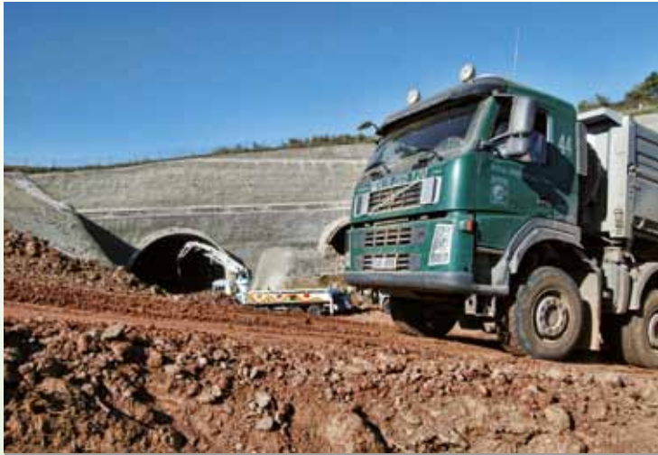
VÝSTAVBA PRAŽSKÉHO PORTÁLU TUNELU PRACKOVICE